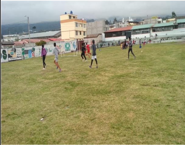
ANEXO 1 ESCUELA DE FUTBOL