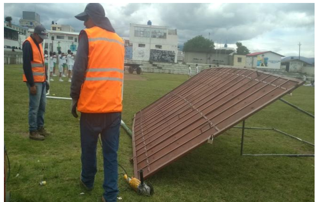
ANEXO 2 PUERTA VIEJA