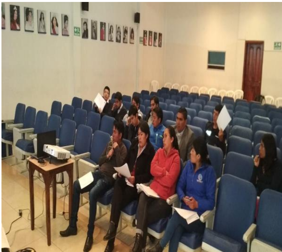
ANEXO 1 CONGRESILLO TÉCNICO