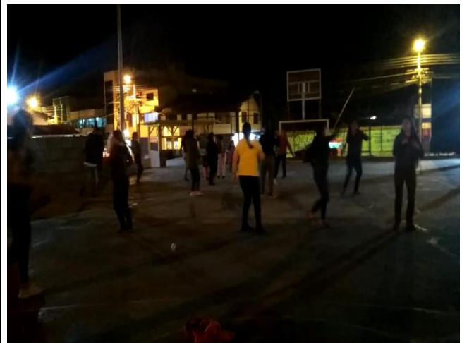
ANEXO 2 BAILO TERAPIA