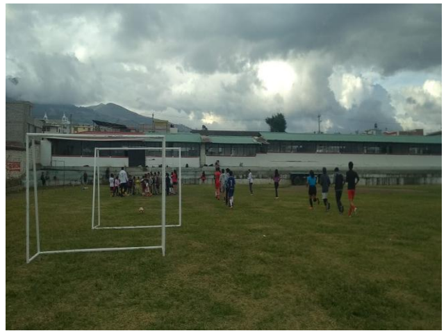
ANEXO 1 ESCUELA DE FUTBOL