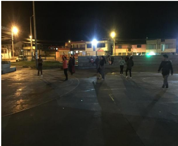
ANEXO 1 BAILO TERAPIA