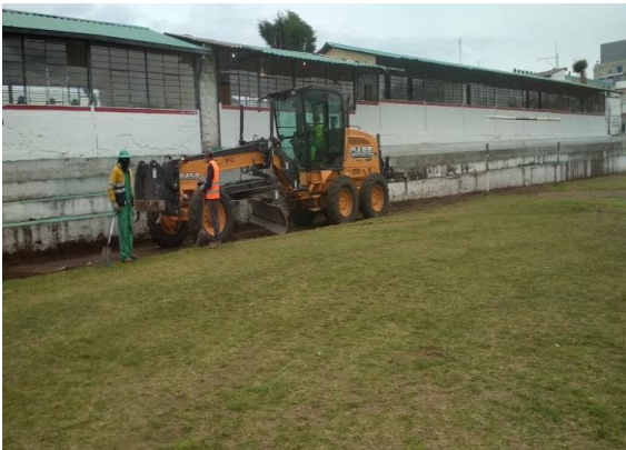
ANEXO 1 ARREGLO DE LAS PITAS ATLÉTICA