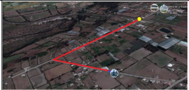
Fotografía 4. Verificación in-situ de Concentración Masiva