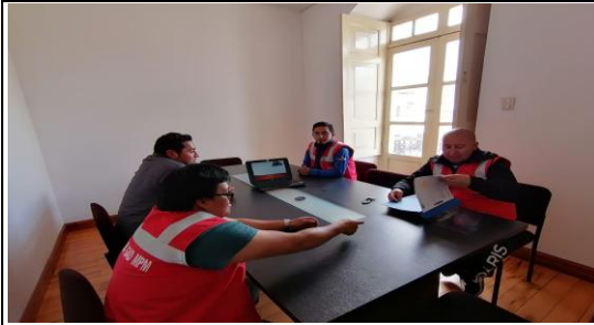
Fotografía 1. Fortalecimiento de capacidades en Gestión de Riesgos con respecto a simulacros