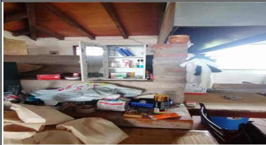
Fotografía 3. Verificación in-situ de Planes de Emergencia y desastres