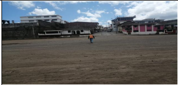
Fotografía 2. Alojamientos temporales por parte del servicio nacional de gestión de riesgos