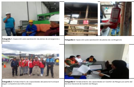
Fotografía 1: Inspección para aprobación de planes de emergencia y desastres