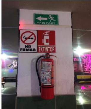
Billar "El Abuelo"