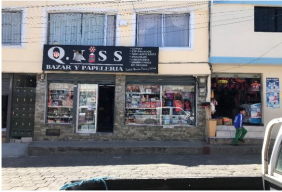
Bazar y papeleria QKISS