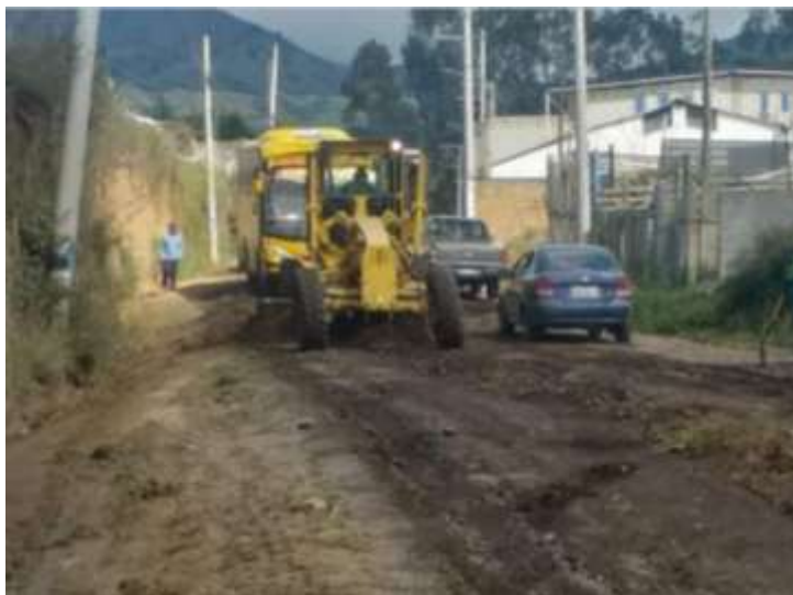
Mejoramiento de vía del Barrio Nuevo Amanecer