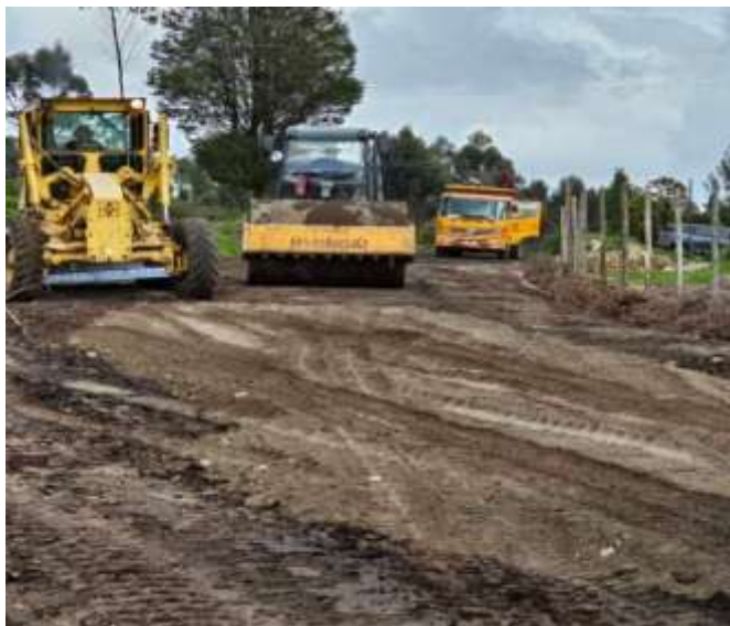
Mejoramiento de vía Comunidad Luis Freire