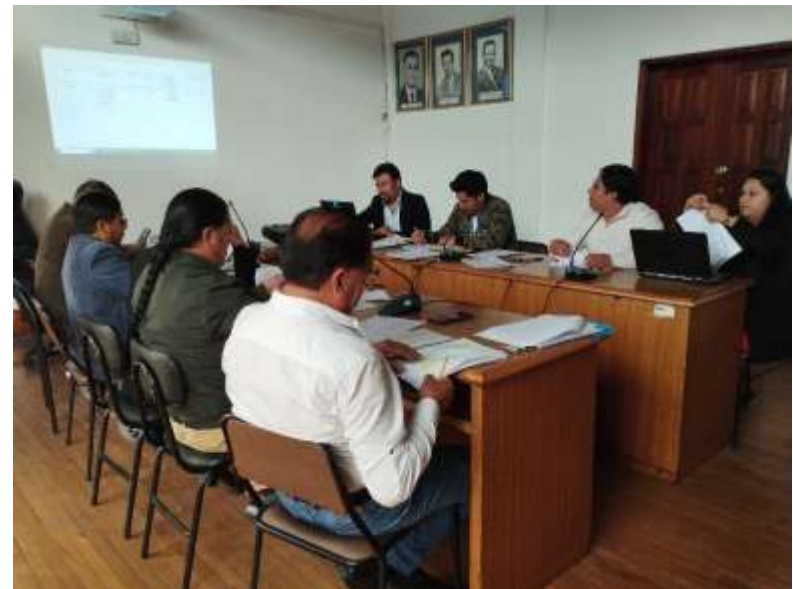
Mesa de trabajo con las Direcciones de: Gestión de Panificación Institucional y Dirección de Planificación y Ordenamiento Territorial