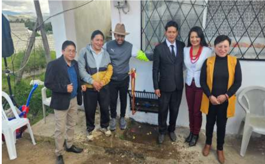
Inauguración alcantarillado Barrio La Quinta

pm PEDRO MONCAYO Cuna del Pueblo Cochacquí ALCALDÍA 2023 - 2027