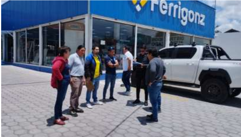
Fiscalización Trámite Unificación de Lotes