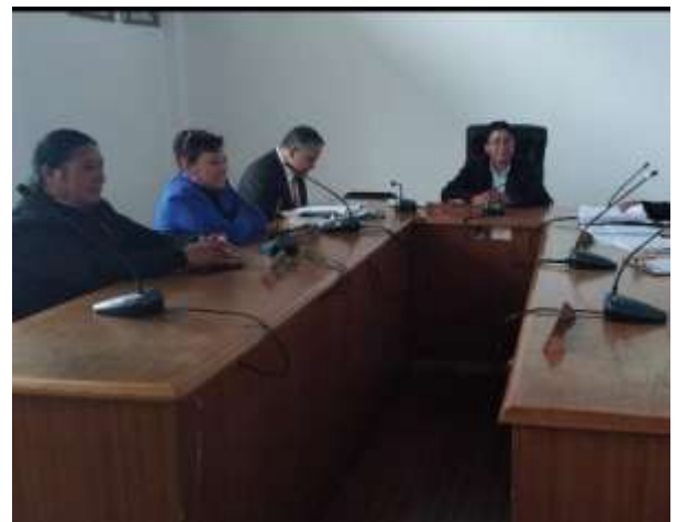
Tabla 22. Documentos Creados en la Comisión de Desarrollo Cantonal