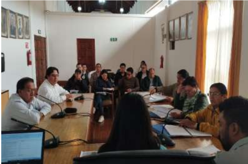
Mesa de trabajo con las Direcciones de: Gestión Administrativa, Gestión de Planificación Territorial, Gestión de Obras públicas, Gestión y Control Público, Unidad de Comunicación.