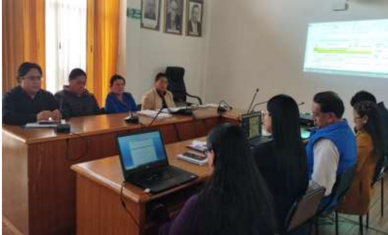
Mesa de trabajo con las Direcciones de: Gestión de Panificación Institucional, Gestión Ambiental, Gestión Financiera