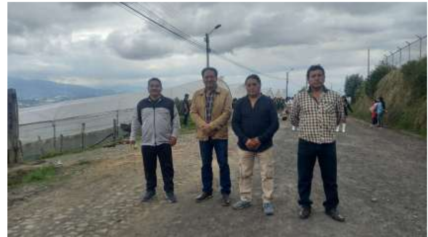
Desfile Unidad Educativa Misión Andina