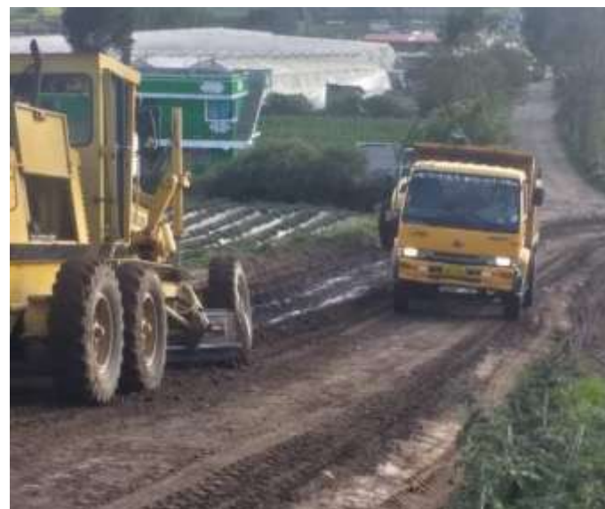
Mejoramiento de vía Comunidad Cajas Jurídica