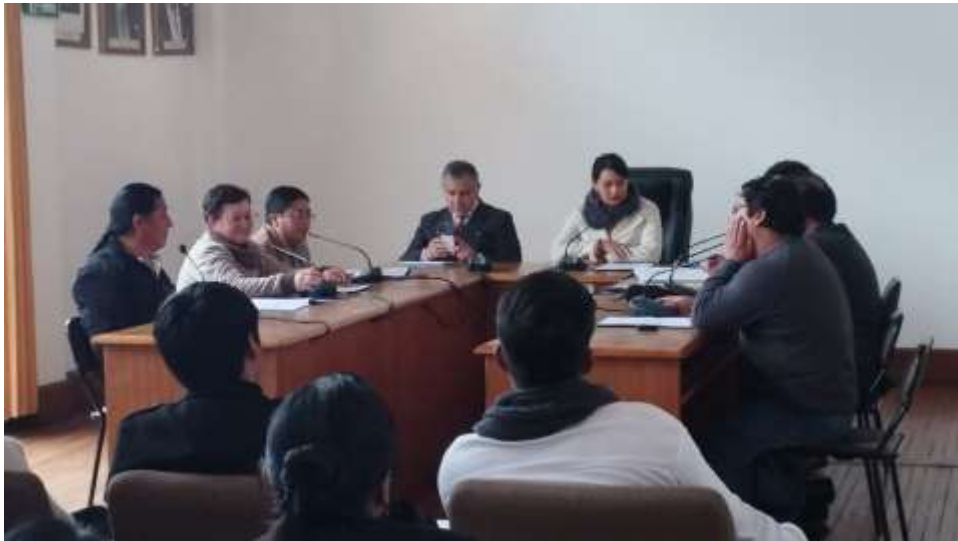
Tabla 8. Sesiones