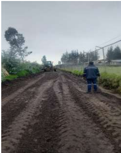
Mejoramiento de las calles del Barrio Marianitas