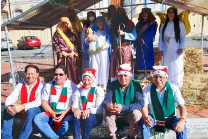
Participación en el Quinto día de la Novena

pm PEDRO MONCAYO Cuna del Pueblo Cochacquí ALCALDÍA 2023 - 2027