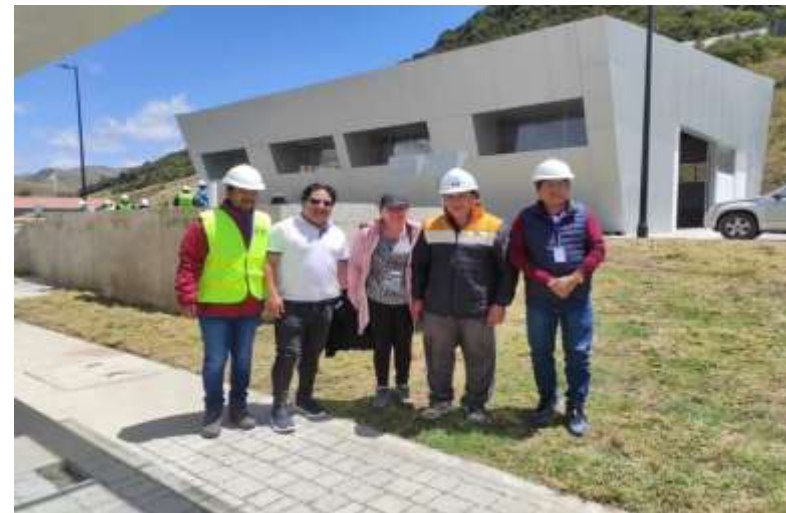
Visita en la Plata de Tratamiento de Agua Potable Pesillo Imbabura