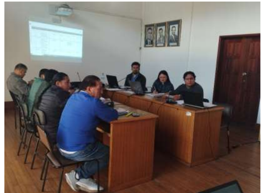
Mesa de trabajo con las Direcciones de: Gestión Ambiental, Gestión de Planificación Institucional, y Procurador Síndico