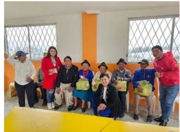
Invitación al evento navideño de los adultos mayores del Barrio La Nueva Esperanza