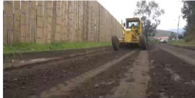
Camino de Angumba a San Luis de Ichisí