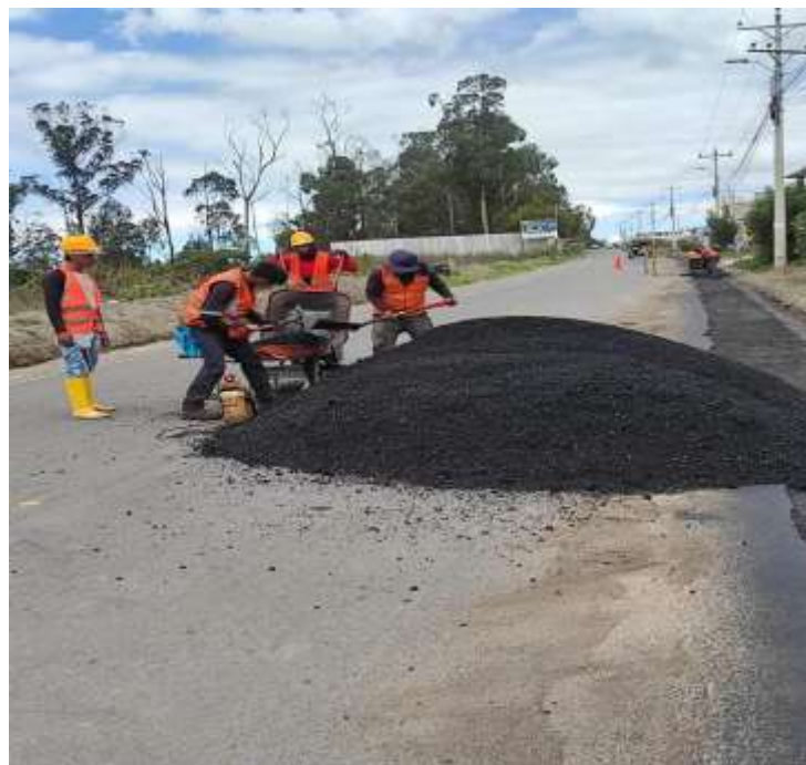
Asfaltado calle Quito de la parroquia de Malchinguí